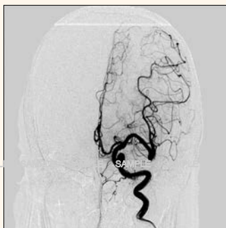
■ 頭蓋内内頸動脈・正面