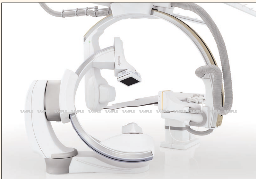
■ キヤノンメディカルシステムズ製 X線診断システム

当院の血管撮影室には、最新型の血管撮影装置が設置されています。 この装置は従来の血管撮影よりも検査時間が短くなり、患者様の負担がより一層 軽減されました。さらに検査中は不安感や苦痛を感じる事なく安全かつ効率的で、 今まで以上に高精度の診断結果は、今後の治療計画から治癒に向けお役立て頂けます。 くわしい検査内容は、医師またはスタッフまでお気軽にお尋ねください。